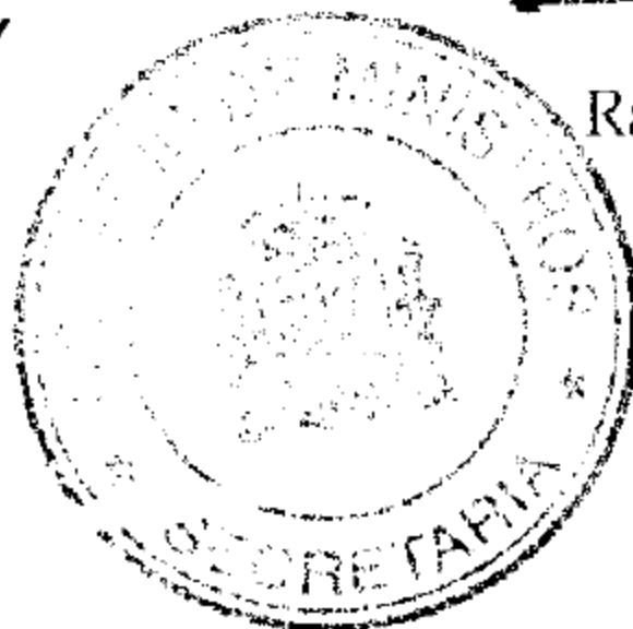
José Luis Rodríguez Zapatero