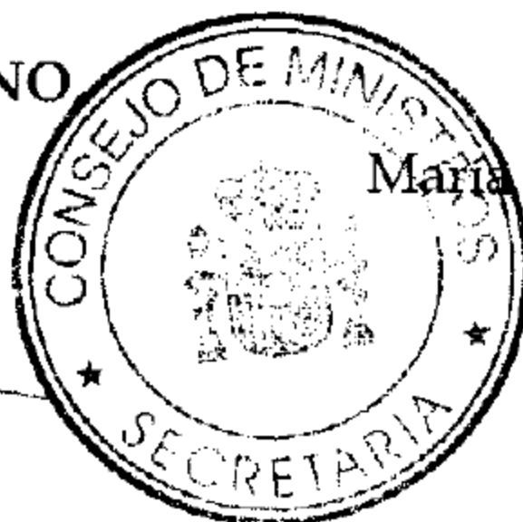
José Luis Rodríguez Zapatero