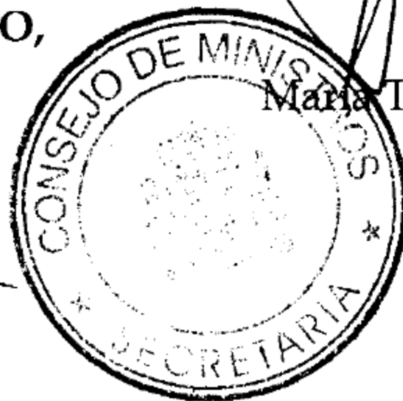
José Luis Rodríguez Zapatero

[Handwritten signature] María Teresa Fernández de la Vega Sanz