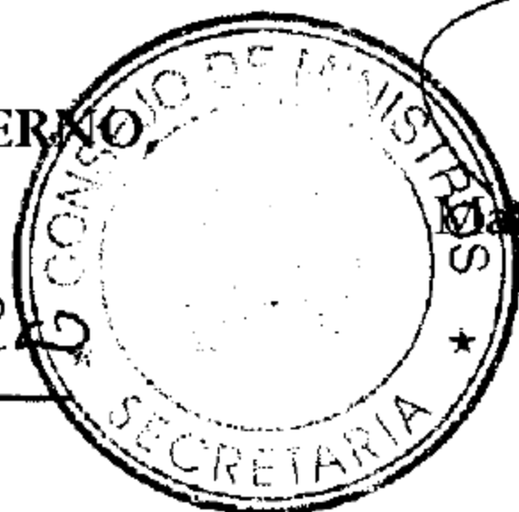
José Luis Rodríguez Zapatero