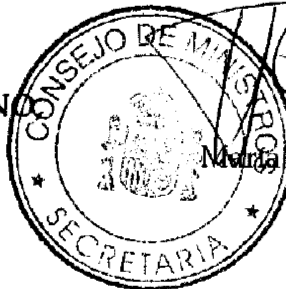
José Luis Rodríguez Zapatero