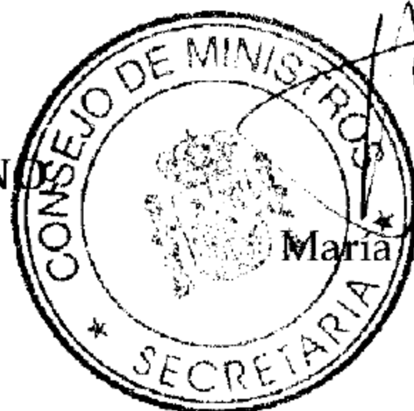
José Luis Rodríguez Zapatero