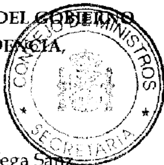
María Teresa Fernández de la Vega Sainza

LA VICEPRESIDENTA PRIMERA DEL GOBIERNO Y MINISTRA DE LA PRESIDENCIA,