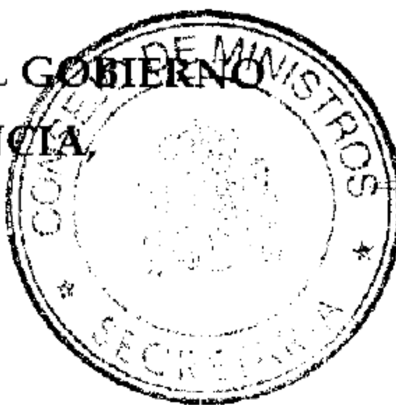
María Teresa Fernández de la Vega Sanz

LA VICEPRESIDENTA PRIMERA DEL GOBIERNO Y MINISTRA DE LA PRESIDENCIA,