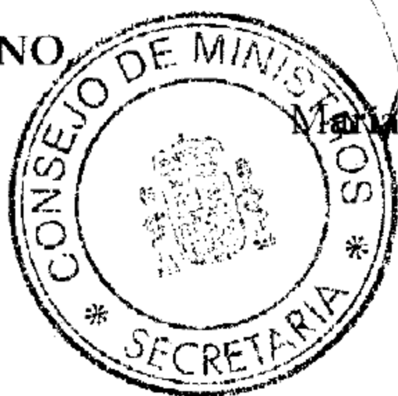
José Luis Rodríguez Zapatero

A handwritten signature in black ink, appearing to read 'María Teresa Fernández de la Vega Sanz', written over a horizontal line.